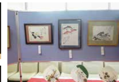
左上) 狭間堺副市長 左) 市長表彰感謝状贈呈 上) 俳画クラブの作品展示