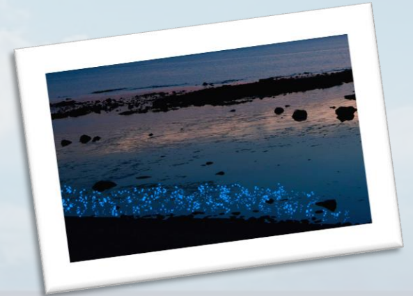
ウミホタルの採取