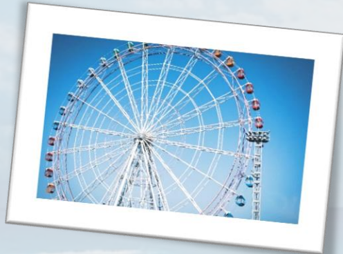
淡路ハイウェイオアシス